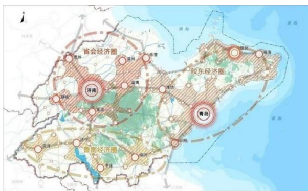
▲ 山东省区域和城镇协调布局图